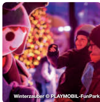
Winterzauber © PLAYMOBIL-FunPark