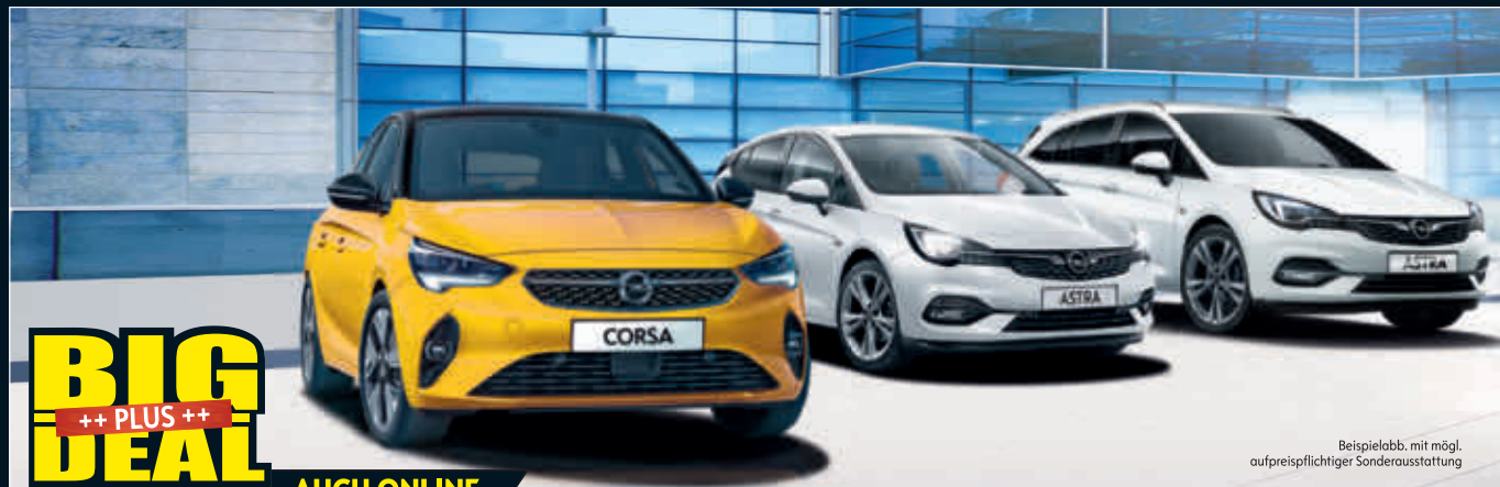
Beispielabb. mit mögl. aufpreispflichtiger Sonderausstattung

Meitingen-Herbertshofen Ulrichstraße 17 Tel. (08271) 813260