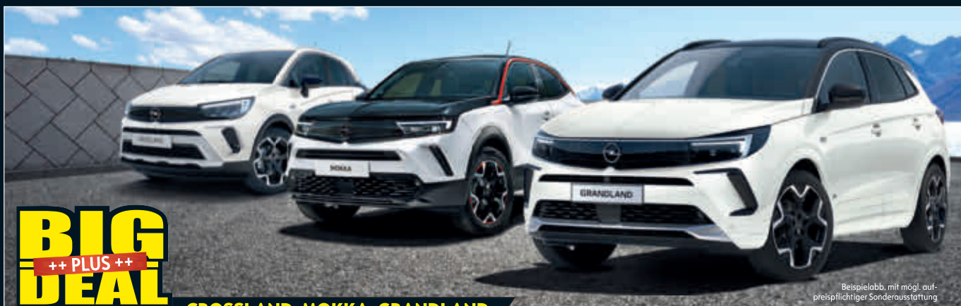
Beispielabb. mit mögl. aufpreispflichtiger Sonderausstattung

BIG DEAL ++ PLUS ++ 6 Jahre Garantie 1) 3 Inspektionen 2) + MATERIAL INKLUSIVE GESCHENKT!