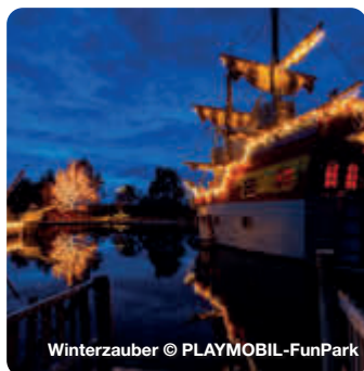
Winterzauber © PLAYMOBIL-FunPark