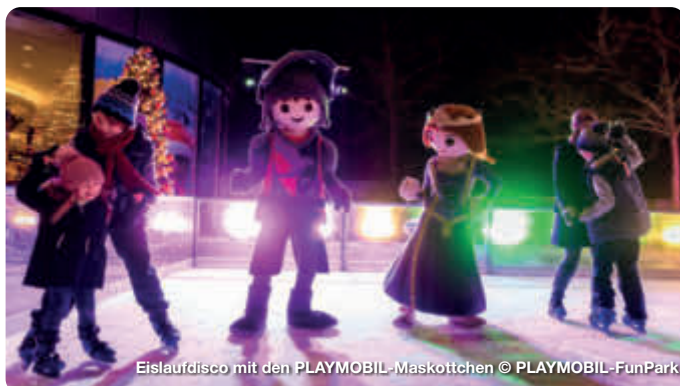
Eislaufdisco mit den PLAYMOBIL-Maskottchen

Auf Grund von Corona sind alle Termine und Angaben unter Vorbehalt!