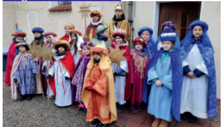
Rommelsried: 1.723 €