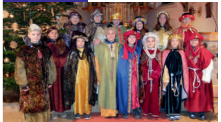
Margertshausen: 3.000 €