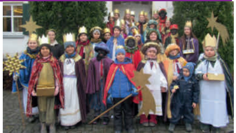
Buch, Kutzenhausen, Maingründel: 4.902 €

Ihre bzw. eure dankbare Pfarreiengemeinschaft Dietkirch.