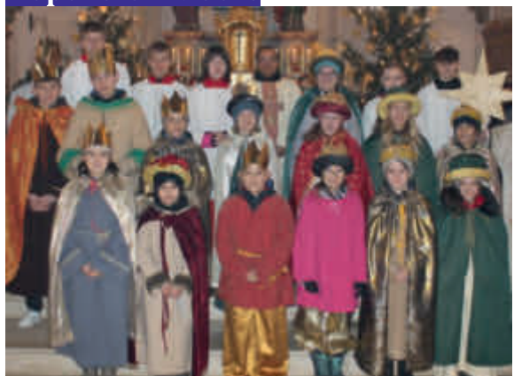
Ustersbach/Mödishofen: 3.165 €