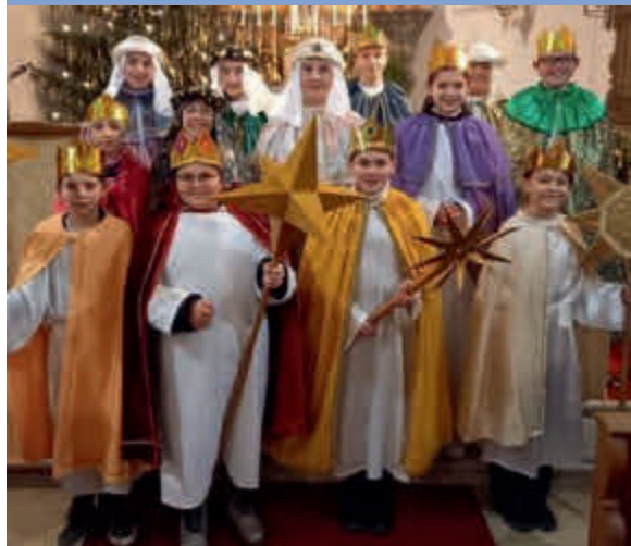
Agawang: 2.920 €