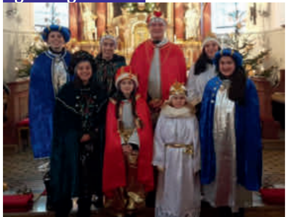
Döpshofen: 905 €