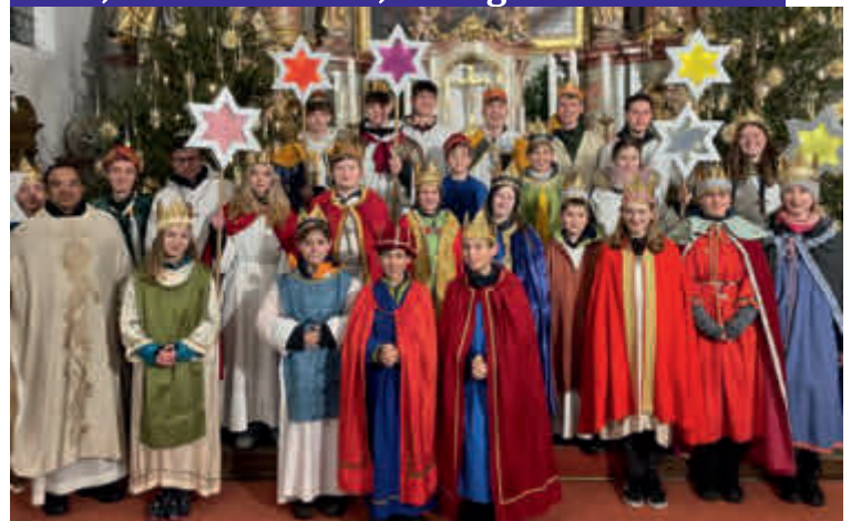
Dietkirch: 5.503 €